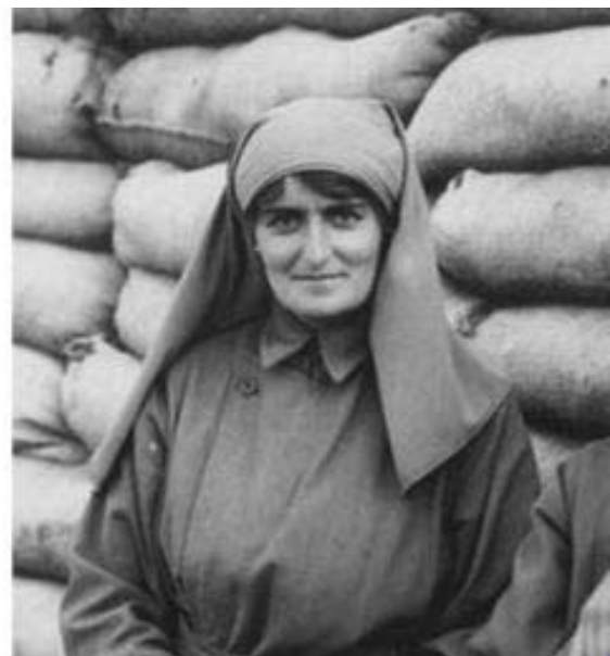
A Memorial in Pervyse for Elsie Knocker and Mairi Chisholm

and The Criminal Conversation of Mrs Norton , (Random House, Preface, 2012)