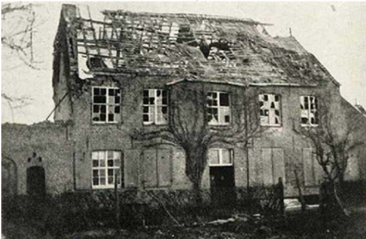
Het eerste 'Kelderhuis' / The first 'Cellar House' A Memorial in Pervyse for Elsie Knocker and Mairi Chisholm

Mairi Chisholm was eighteen-years-old. She was not a trained nurse and had no experience except in driving a motorcycle. During one of her rides, she met the English woman Elsie Knocker.