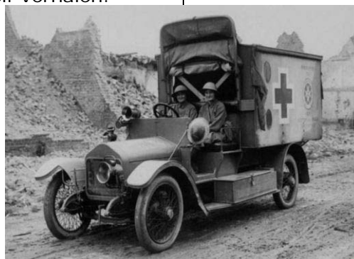
A Memorial in Pervyse for Elsie Knocker and Mairi Chisholm

The story of Elsie Knocker and Mairi Chisholm is one of the eleven stories.